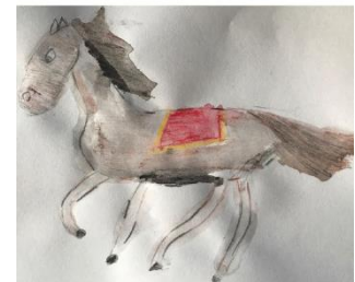
Trippel trappel trippel trap...

We hopen dat we allemaal op 6 december een verrassing verdienen. Onze schoen staat alvast klaar!